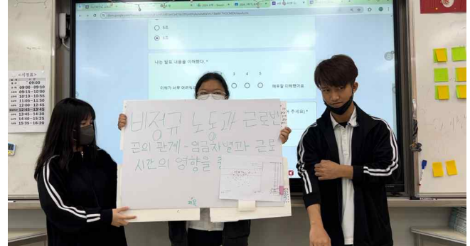
발표하는 모습 2