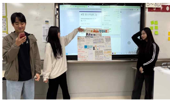
발표하는 모습 1